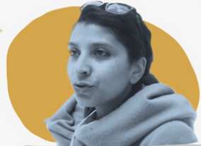
KARIMA NADIR DEFENSEURE DES DROITS HUMAINS