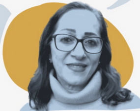
SAMA AWEIDAH WOMEN'S STUDIES CENTRE

COMMENT la TECHNOLOGIE peut-elle aider ?